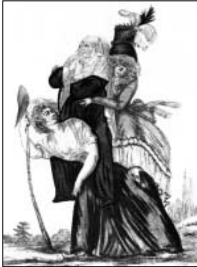
"Het is te hopen dat het snel met mij is afgelopen"