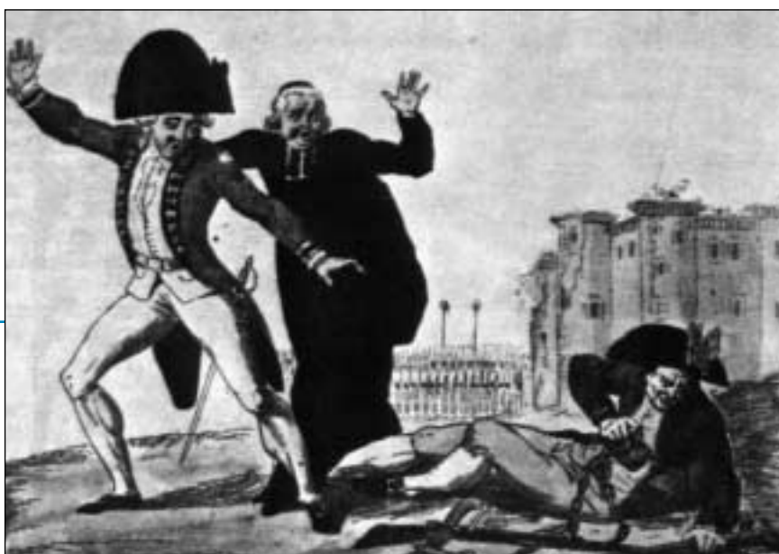
Het ontwaken van de derde stand.