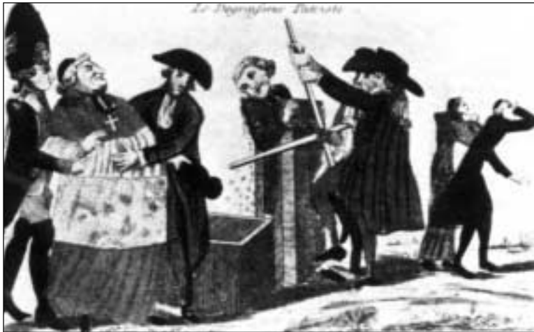
De revolutionaire ontvetter.