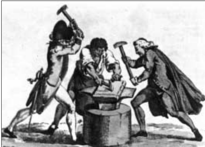
"Vlug, vlug, vlug! Smeed het ijzer als het heet is!" De nieuwe grondwet.